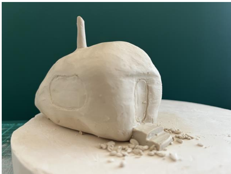
Obrázek 1: Moje navržená útulna ve tvaru kamene.

Další den jsme dokončovali návrhy a modely svých ubytoven, následně jsme odprezentovali svoje dílo před ostatními. Dále jsme si měli vybrat jednu ze zadaných moderních staveb a následujícího dne v krátkosti o ní něco říci.