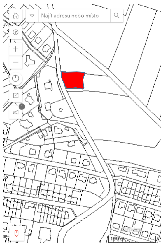
Obrázek 2: Výběr pozemku.

V tento den jsme prezentovali námi vybranou stavbu. Byl nám zadán poslední a nejobtížnější úkol – navrhnout a vytvořit svůj vysněný dům na námi vybraném pozemku. Měli jsme na to čas do konce kurzu, do pátku. Mnohým z nás i tak nestačily tři dny a museli jsme na projektu pracovat i doma.